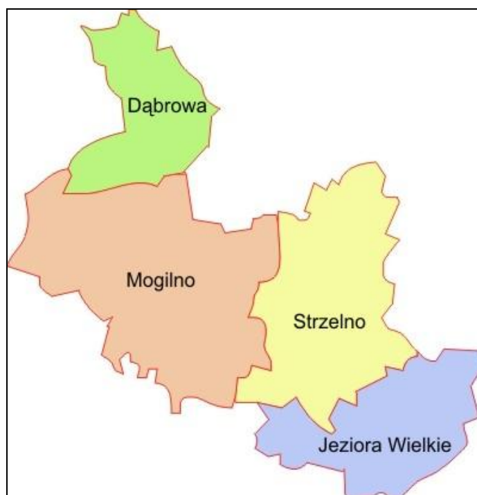
Rysunek 2 Mapa administracyjna Powiatu Mogileńskiego