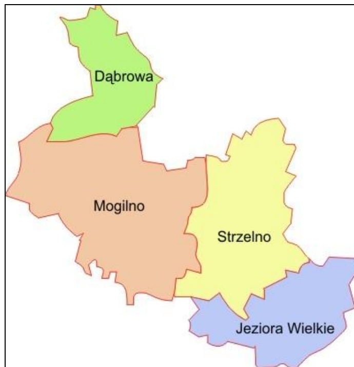
Rysunek 2 Mapa administracyjna Powiatu Mogileńskiego